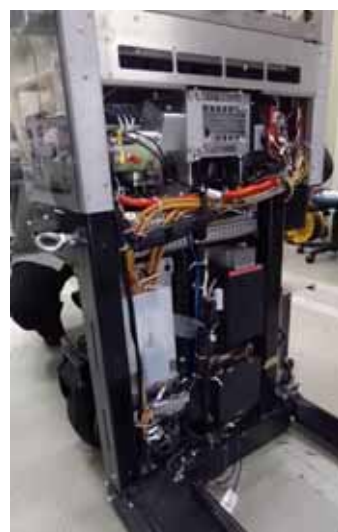
図1 試作4号機の開発